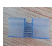
4ピン接続コネクタ