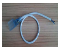
コネクタケーブル