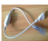
ACコンバートケーブル