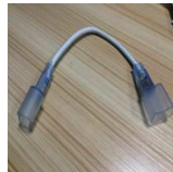
接続コネクタケーブル