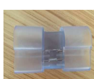
2ピン接続コネクタ